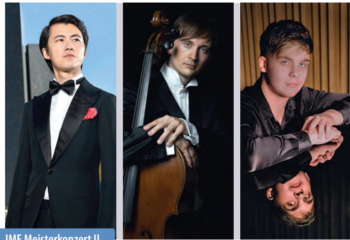
IMF Meisterkonzert II

Samstag | 07.09.2024 | 20:00 Uhr | Eintritt 28,00 € Königsmarcksaal im Alten Rathaus | Hökerstraße 2 | 21682 Stade IMF Meisterkonzert II